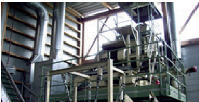
Ölfilterbehandlungsanlage (Rütli b. Büren)

Thommen-Furler AG betreibt eine Filterbehandlungsanlage, womit verschiedene Abfallfraktionen wiederverwendet werden können. Die Filter werden bei den Garagen abgeholt und nach Rütli b. Büren gebracht. Nach einer Grobtriage nach Fremdkörpern (z.B. Metallteile) werden die Filter zerkleinert und weiter in eine Zentrifuge geführt. So werden Öl- und Kraftstoffreste abgetrennt. Dank eines Magnets bleiben die Alteisenteile haften und ihrerseits von Papier und Karton getrennt.