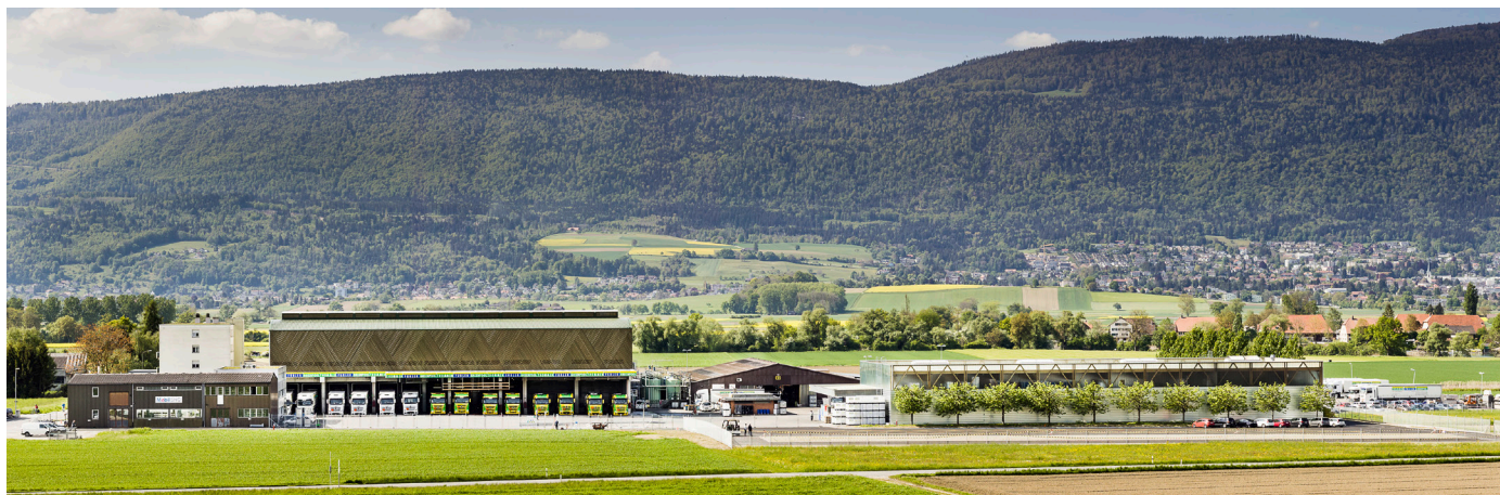
Betriebsstandort Rüti b. Büren

Unsere Verpflichtungen gegenüber Kunden, Lieferanten und Mitarbeitern sowie unser ökologisches und soziales Verhalten haben wir im Rahmen der Unternehmensgrundsätze, der Qualitäts-, Umwelt- und Sicherheitspolitik sowie in einem Verhaltenskodex festgelegt. Thommen-Furler AG richtet alle Tätigkeiten nach diesen Richtlinien aus.