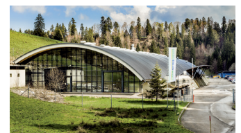
Standort La Chaux-de-Fonds